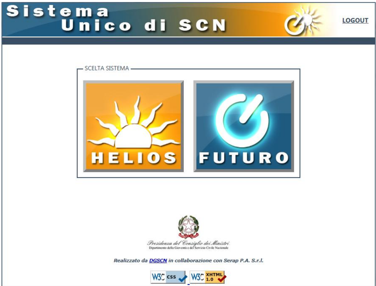
Figura 2 Scelta del Sistema